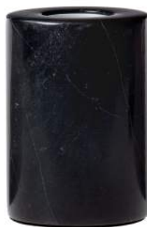
Réf. / Part number : 000016-MN