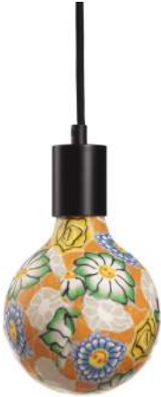
043970-8W2700-P2 178 x diam. 125 mm

Matériaux / Materials : Verre et céramique / Glass and ceramic