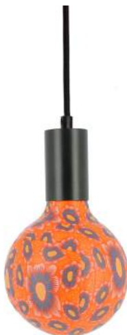
043970-8W2700-P028 178 x diam. 125 mm