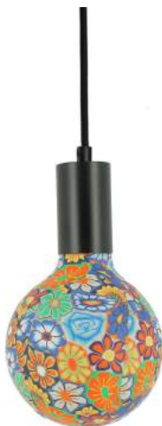
043970-8W2700-P025 178 x diam. 125 mm