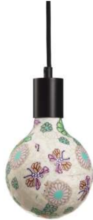
043970-8W2700-P4 178 x diam. 125 mm