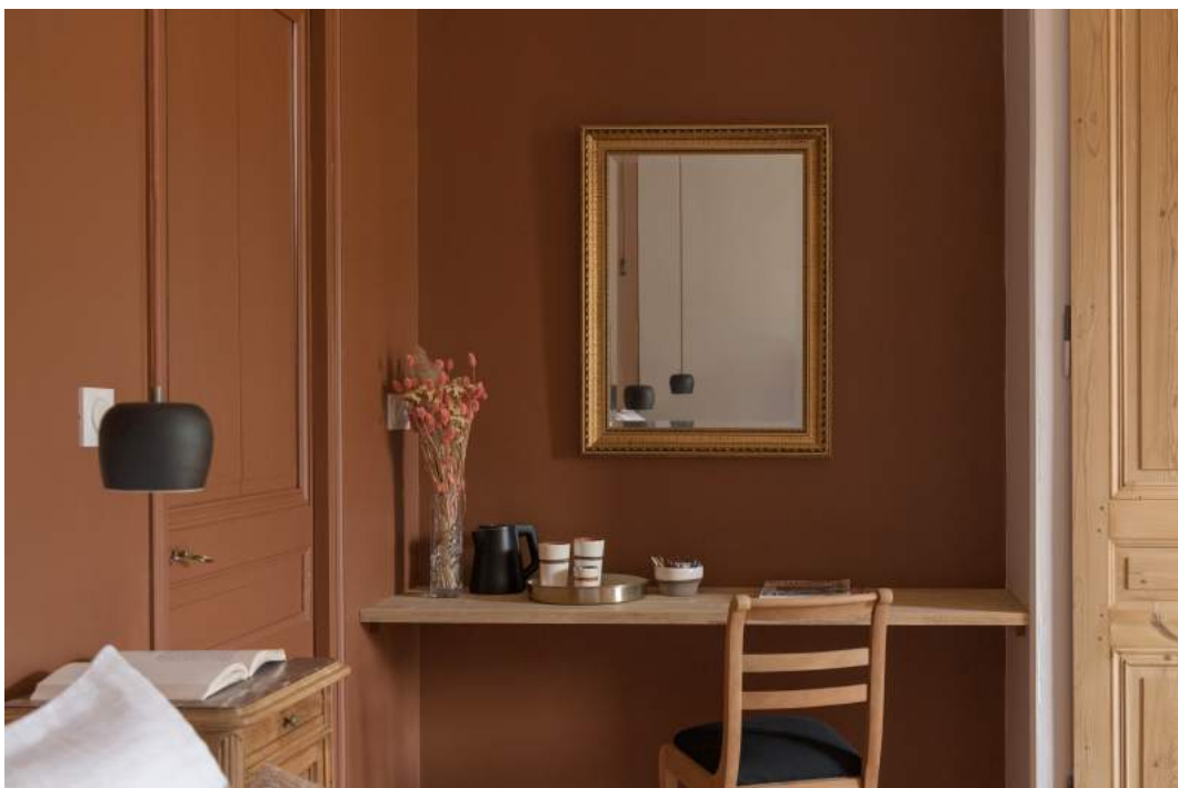
MARCEL / LA MAISON DES MONTS D'OR Suspension céramique / Ceramic pendant lamp #000226-P Email noir mat - Serre-câble gris titanium - Cable argile