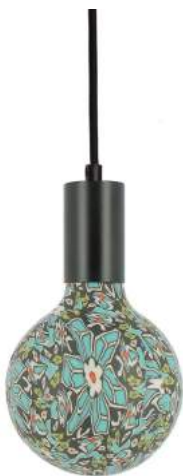
043970-8W2700-P003 178 x diam. 125 mm