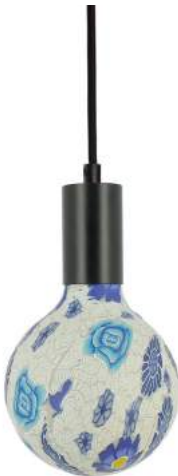
043970-8W2700-P049 178 x diam. 125 mm