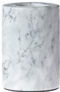
Réf. / Part number : 000017-MB