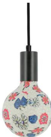
043970-8W2700-P050 178 x diam. 125 mm