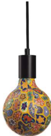
043970-8W2700-P9 178 x diam. 125 mm

230 VAC / E-27 / 8W / 2700°K / dimmable / 20 000 h. / A-B