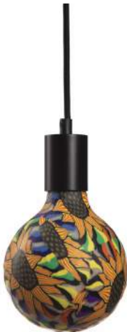
043970-8W2700-P7 178 x diam. 125 mm