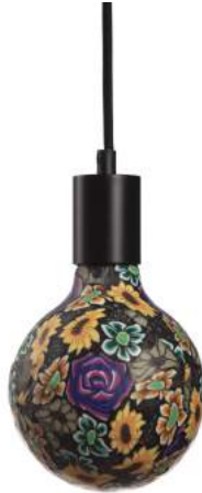
043970-8W2700-P3 178 x diam. 125 mm