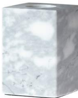
Réf. / Part number : 000018-MB