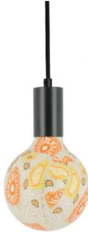
043970-8W2700-P036 178 x diam. 125 mm