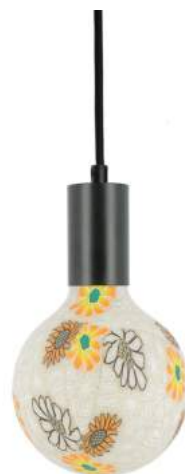
043970-8W2700-P032 178 x diam. 125 mm