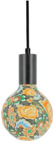
043970-8W2700-P033 178 x diam. 125 mm