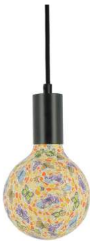
043970-8W2700-P010 178 x diam. 125 mm