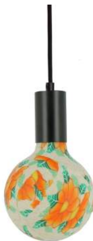
043970-8W2700-P023 178 x diam. 125 mm