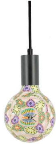
043970-8W2700-P042 178 x diam. 125 mm