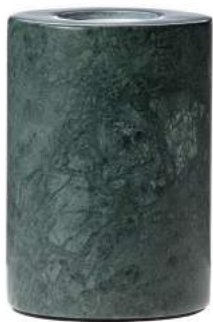
Réf. / Part number : 000015-MV