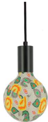
043970-8W2700-P051 178 x diam. 125 mm